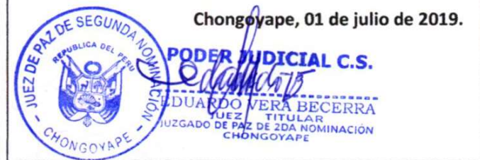
Sello y Firma del Juez de Paz