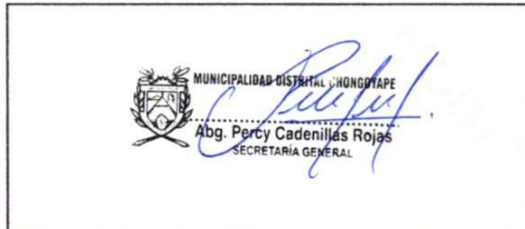
Sello y Firma de la Secretaria General